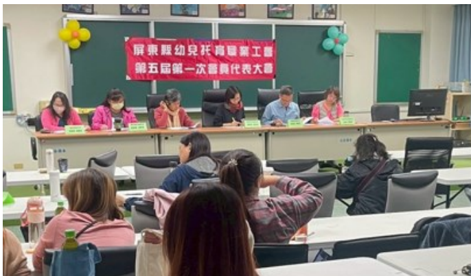
屏東縣幼兒托育職業工會第五屆第一次會員代表大會