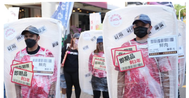
移工打扮為超市量販的「鮮肉」商品，隨著遊行隊伍前進，「鮮肉」逐漸逼近保存期限，直到被貼上「即期品」貼紙，最終面臨「已到期」的命運。（攝影：王顥中）

今年移工遊行維持過往慣例，出動龐大精美道具，包含打扮為超市量販的「鮮肉」商品，上頭還貼有「耐操」、「便宜」、「拋棄式」、「有效期限：12年」等標籤，隨著遊行隊伍前進，「鮮肉」逐漸逼近保存期限