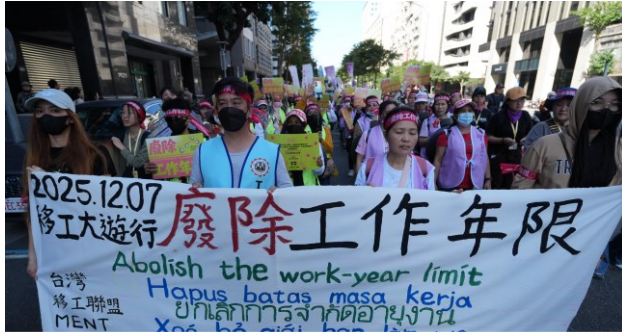
移工遊行訴求廢除藍領移工在台工作年限。

」時，同步廢除白領移工的年限限制，白領自此得以無上限在台工作，但藍領至今仍受年限限制，形成藍白領間不同待遇的歧視性政策。