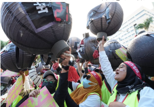
移工遊行在終點立法院前扔擲「定时炸弹」道具，象徵炸開工作年限枷鎖的訴求。